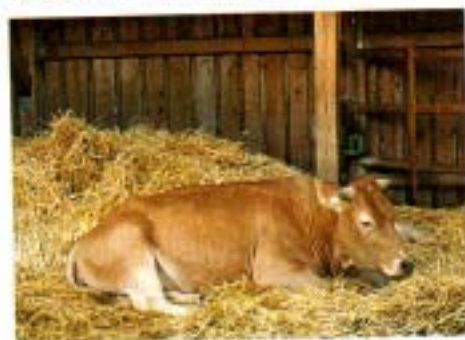
Bäuerlicher Rastmarkt: Streichelzoo für Kinder

Für Menschen, die nicht nur gut essen, sondern auch toll einkaufen wollen.